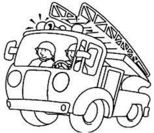
Feuerwehrteller (Nudeln mit Tomatensoße) 4,00 €