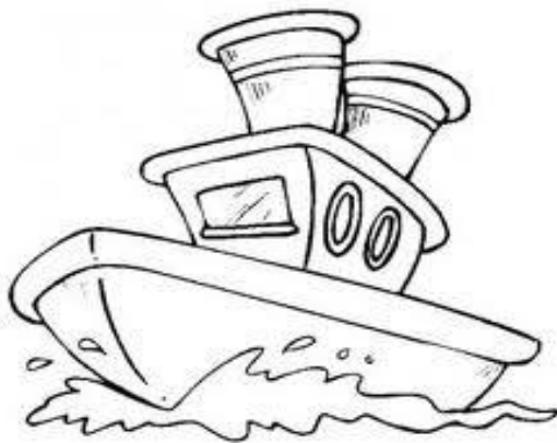
Seemannsgarn (3 Fischstäbchen mit Kartoffelpüree) 4,50 €