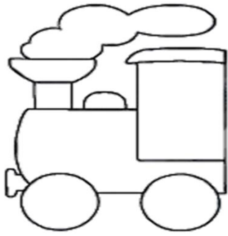
Lokteller (Pommes mit Schranke) 2,00 €